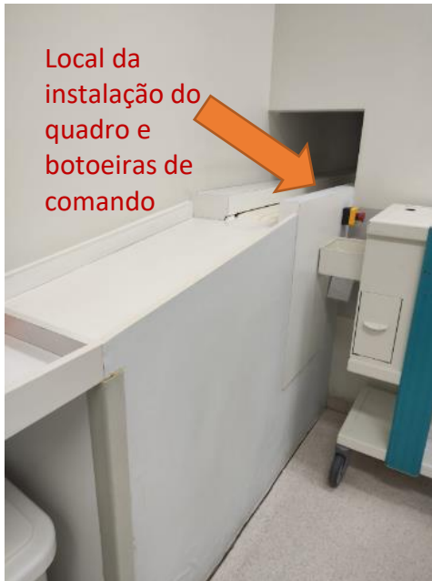
Figura 3 - Local de Instalação do Quadro