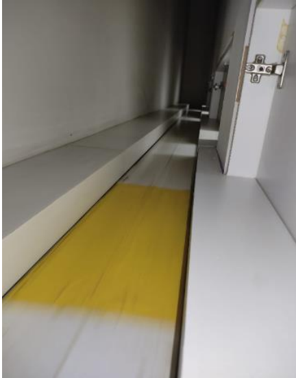
Figura 1 - Emenda na correia