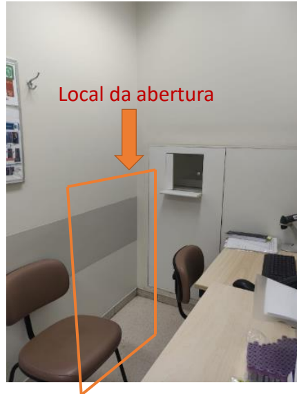
Figura 2 - Abertura do Drywall