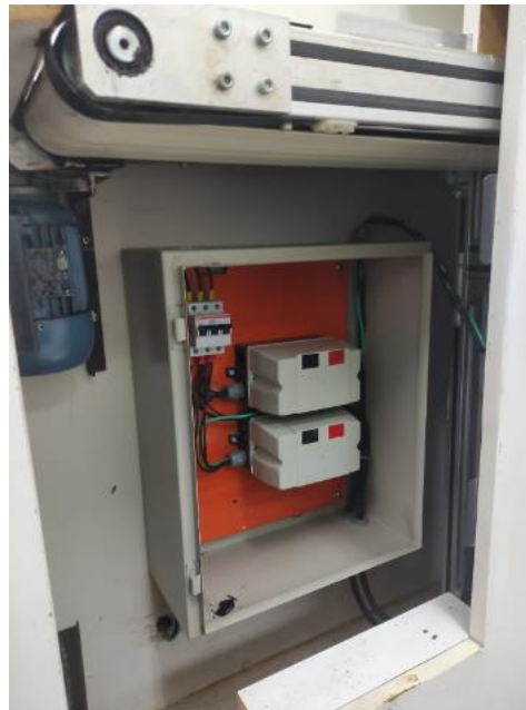
Figura 4 - Quadro Atual